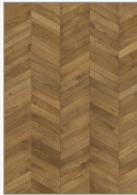
Dub Chevron Light Brown