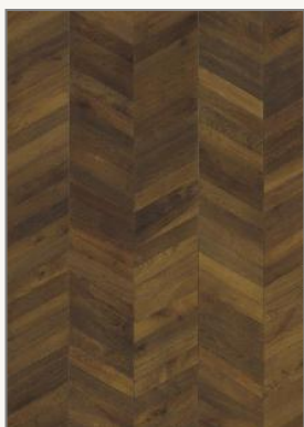
Dub Chevron Dark Brown