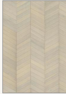
Dub Chevron White