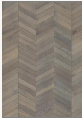
Dub Chevron Grey