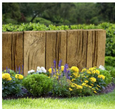
DITON Linie dřeva – palisády DUB světlý