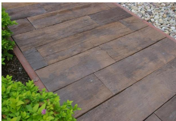
DITON Linie dřeva – prkna SMRK tmavý

Prvky řady DITON Linie dřeva jsou vyráběny z více druhů probarveného samozhutnitelného betonu, který se odlévá do speciálních forem. Probarvenost znamená, že oděrku na betonu nijak nepoznáte, protože beton není obarvený jen na povrchu, ale v celém objemu. Vícebarevný beton se používá z důvodu větší přirozenosti a věrohodnosti výsledného dojmu, protože i ve skutečném dřevě jsou viditelně znatelná léta tmavší a světlejší. Litá prkna vykazují vysokou pevnost, povrch je mrazuvzdorný a odolný proti působení vody a chemických rozmrazovacích látek, má nízkou obrusnost a dobré adhezní vlastnosti. Vysoká otěruvzdornost dovoluje reliéfní prkna použít i jako „rohožku“ (vhodná jsou dubová prkna s hlubším reliéfem), vzhledem k maximálnímu stupni ochrany povrchu prkna neabsorbují žádné nečistoty.