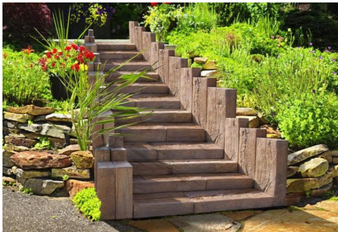
DITON Linie dřeva – schody DUB světlý

Řada DUB Linie dřeva ve světlém a tmavém odstínu zahrnuje čtyři rozměry dřevěných prken od 25 cm dlouhých až po metrové, všechny o výšce 5 cm, dále pak schody ve dvou šířkách a výšce 15 cm a palisády rovněž ve dvou rozměrech. Pro jednotlivé formáty prken se vyrábí pět různých reliéfů povrchu, aby šly kombinovat a výsledné plochy nebyly jednotvárné, ale budily dojem přírodních nepravidelností, kdy každé prkno je originál. Schody pak mají čtyři různé reliéfy a palisády dva.